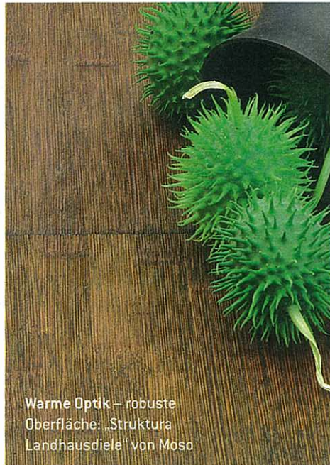
Warme Optik – robuste Oberfläche: „Struktura Landhausdiele“ von Moso

In Europa steigt die Nachfrage stetig, vor allem nach Bambusparkett, das durch seine außergewöhnliche Maserung auffällt. Der natürliche Bodenschatz wird in sieben Produktionsschritten gefertigt. Erst wird das Rohr der Länge nach gespalten, gehobelt, gesäubert, gebleicht und gedämpft, damit die warmen Brauntöne entstehen. Schließlich wird es in Streifen zu Platten verleimt. Bambusparkett kann im Laufe seines Lebens mehrfach abgeschliffen und neu oberflächenbehandelt werden. Achten Sie beim Kauf auf Qualität: Es gibt Billigware, die mit Pestiziden belastet ist.